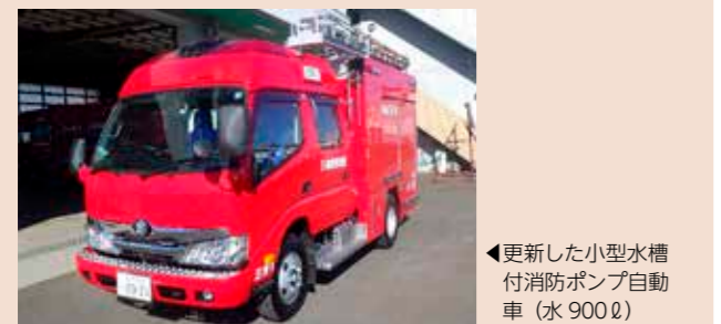
◀ 更新した小型水槽付消防ポンプ自動車 (水 900ℓ)

令和3年2月8日(月)西消防署三芳分署に配備する消防ポンプ自動車を16年ぶりに更新しました。この車両はコンパクトなボディを活かし、狭あい箇所での活動が期待されるほか、シャーシ・フレームには重量バランスを考慮したサブフレームを採用することで、運行時の荷重に十分耐えられる構造となっています。また、LED式照明を多く採用したことで夜間の安全性の向上に繋がる仕様となっています。