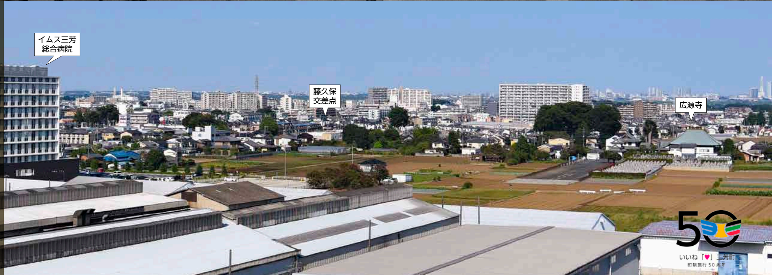
【写真】浄水場の配水塔から藤久保交差点方向を望む(上)1970年(下)2020年