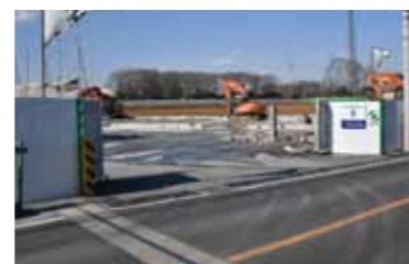
企業誘致第 1 号の工事着工の様子。

三芳スマート IC 周辺の町道幹線 3 号線を企業立地促進指定エリアと定め、流通業務施設の誘導を図っています。平成 29 年度に企業誘致担当を設置以降、積極的に誘致活動を進め、上富・北永井地区に区域指定を行いました。指定に向けた協議も継続しています。