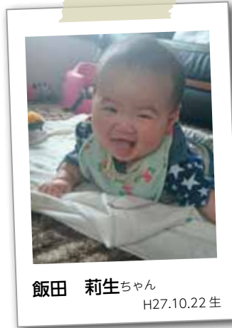
飯田 莉生ちゃん H27.10.22 生