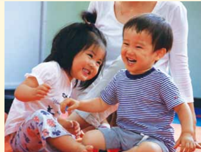
最初は緊張していた子どもたち。最後は身体を揺らしたり飛び跳ねたり、元気な笑顔で楽しみました。