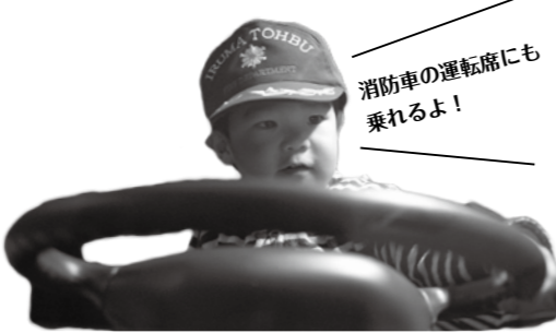
消防車の運転席にも乗れるよ!

▶防災館で体験しませんか? 防災館は、災害時もしもの際の行動要領等を学べる施設です。119番通報の仕方や消火器の取り扱い等を気軽に学べます。いざという時のための「心の備え」を親子でぜひ体験してください。(入館無料) ☎ 警防課 (☎261-6659)