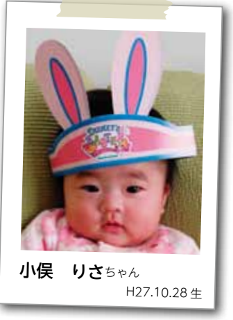
小俣 りさちゃん H27.10.28 生