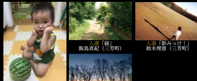
準グランプリ スイカ冷たい〜 川田典子(三芳町)