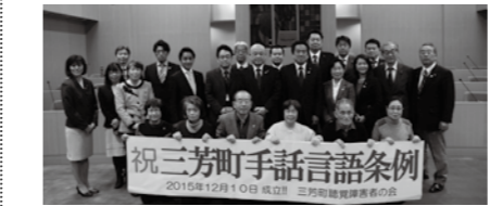
問 福祉課障がい者支援担当 ☎ 176

【手話言語条例】手話の理解と広がりをもって地域で支え合い、手話を使って安心して暮らすことができる環境整備を行うため普及啓発に取り組み、三芳町で推進する『あいサポート運動』の理念である「障がいを知り共に生きる」を実現するためにも、住民が互いの言語を尊重し、それぞれの言語を介して意思疎通を図り、共に生きる社会（共生社会）を構築することをめざしていきます。