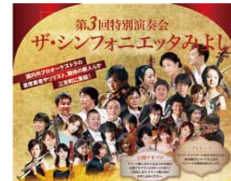
この日、日本オーケストラ連盟の呼称が「ザ・シンフォニエッタ」に変更されたことにより、交響楽団の活動が盛んになり、市民の音楽生活が豊かになることを目指して、三芳町に「ザ・シンフォニエッタ」を創設します。

今年で第 3 回となるザ・シンフォニエッタみよしの特別演奏会。国内外プロオーケストラの首席奏者やソリスト、期待の新人らが三芳町に集結! “国内最響”の室内オーケストラが極上の響をお届けいたします。