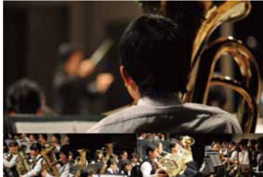
一中学生たちの日頃の成果をお楽しみください。ゲストには県内強豪校の川越南高校吹奏楽部をお迎えします。

最近のコンクール等での活躍がめざましい三芳町の中学校吹奏楽部。彼らが一堂に集まって、感動のステージを創りあげます。