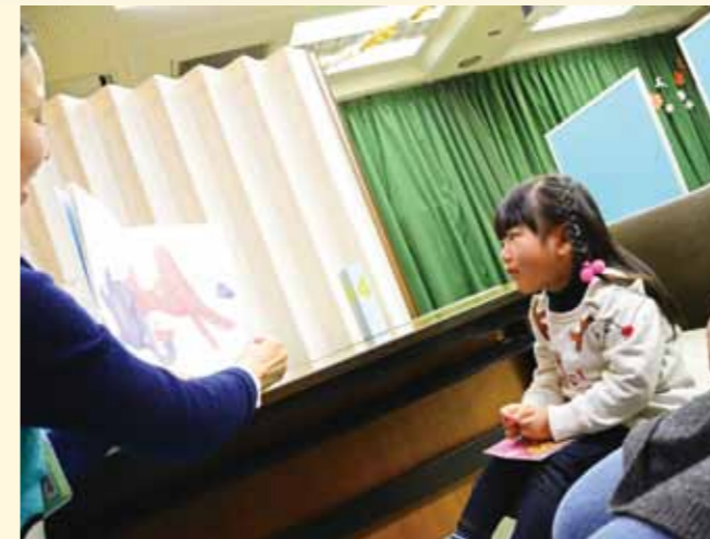
「もう一回読んで」とおねだりする子も。すっかり絵本の世界のとりこになったようです。