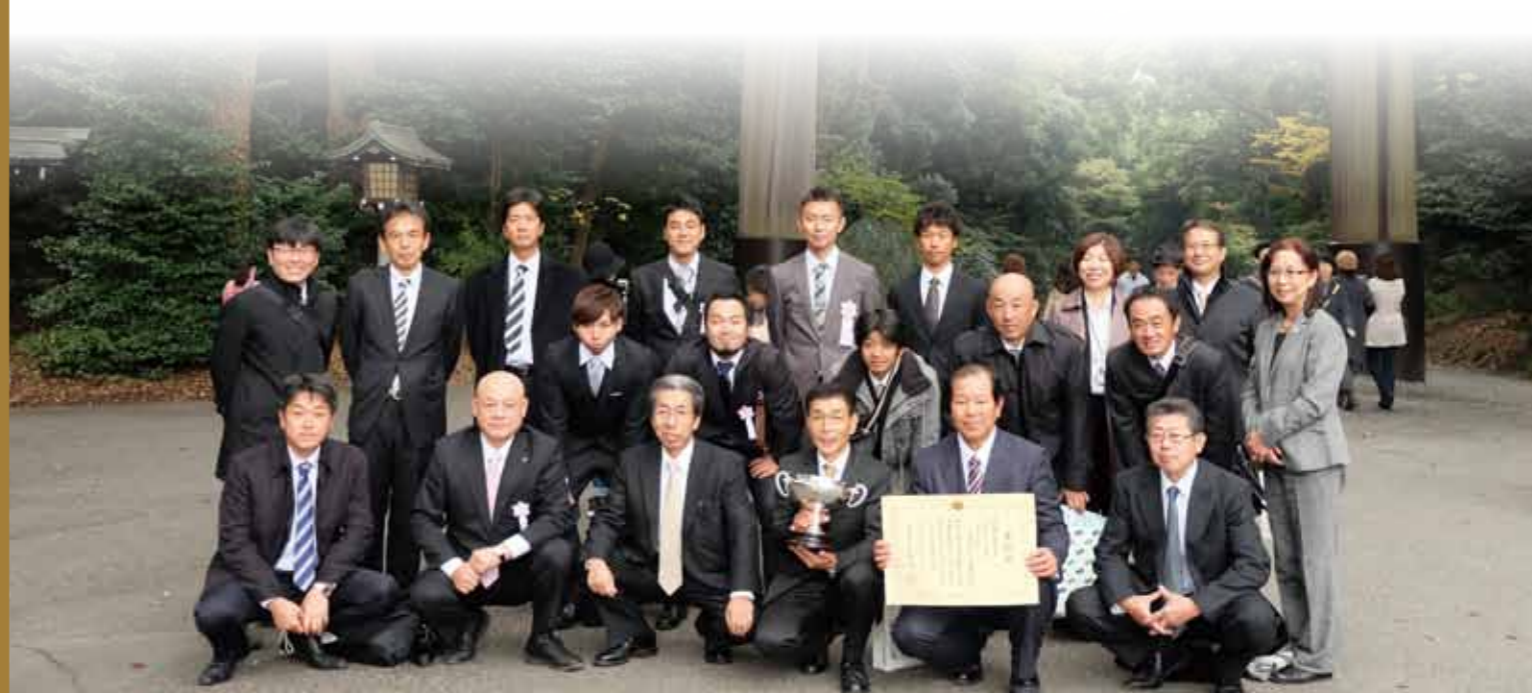
11月23日に明治神宮で開催された農林水産祭のあと、受け取った天皇杯と表彰状と共に三芳町川越いも振興会の皆さんと。

私も、今年一年、先人たちの『至誠』 を受け継ぎ、息むことなく、町づくり に励んでまいりたいと思います。 皆様方の益々のご健勝と、ご多幸 をお祈りし、年頭のごあいさつといたし ます。