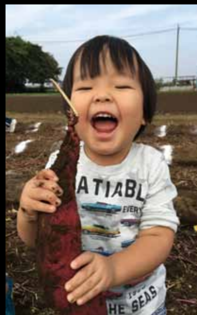
「大きいおいも取ったぞー！」