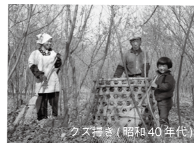
クズ掃き（昭和40年代）

農閑期という休暇のように思われるが、作物の手入れや収穫がないだけで実は忙しい。その冬仕事の代表格がクズ掃きである。三芳では昭和三十年代後半まで、正月は月遅れの二月正月で行っていたというが、これにはいかなったためといわれ、冬場のクズ掃きは、年中行事のあり方をも決める大切な仕事であったことがうかがえる。