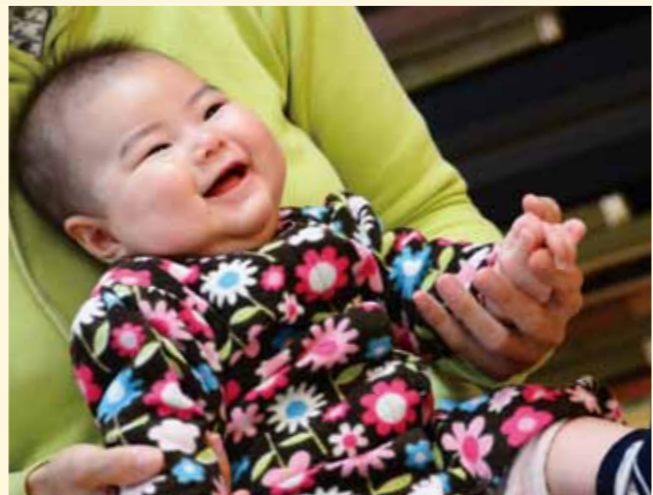
赤ちゃんもお互いが気になるようで、じ〜っと見つめたり、笑い合ったりする姿が見られました。