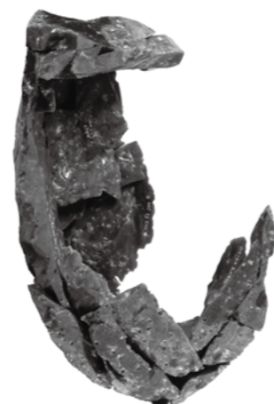
石器作りの手順がわかる接合資料

発見された石器の石材の大半は黒曜石でした。黒曜石の原石は近くの河原で採取できるものではなく、遠方から持ち込まれたものです。中東遺跡から発見された黒曜石を理化学的に分析した結果、伊豆半島や信州など百キロメートル以上も離れた場所を産地とすることがわかりました。第2地点の石器を製作した跡では、13センチメートル大の伊豆半島産黒曜石の原石から石器を作り出す手順がわかる、貴重な資料も発見されました。