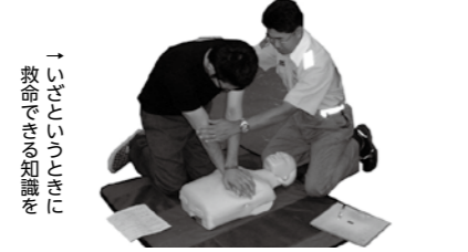
救命講習の知識を

☎入間東部地区消防組合消防本部救急課 ☎ 261-6673 (平日のみ 8:30～17:00)