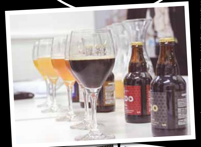
問 観光産業課商工観光係 (内線214・215)

町内には、まだまだ知られていない「キラリ」と光る事業所が多く存在します。そんな事業所を町長自ら訪問して、事業所の概要や今後の展望等を聞き、それを住民に紹介する「町のキラリ★町長の事業所訪問」を3月25日(月)に実施しました。