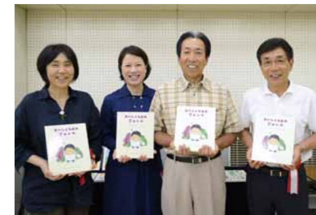
↓絵本制作に携わった皆さん。想いの詰まった素敵な絵本が完成しました。

7月7日(金)、三芳町役場で認定農業者の認定式が行われました。認定農業者制度とは、農業経営基盤強化促進法に基づき、農業者自らが5年後の農業経営改善の目標と達成のための取組内容記載した農業経営改善計画を作成し、市町村が作成する基本構想に照らして、認定する制度です。本年は新規で5人が認定農業者に認定されました。