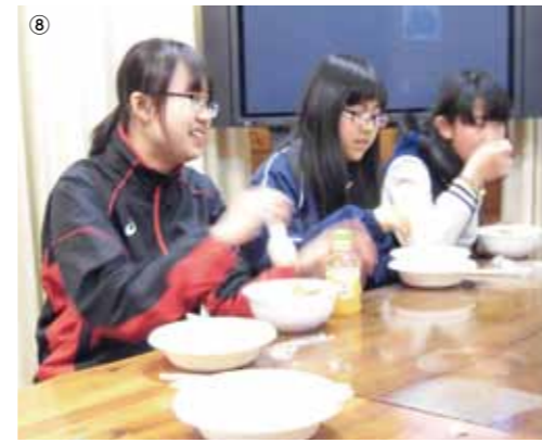
①顔合わせ会 ②⑦成人式 ③⑧宿泊研修・秩父 ④開講式・昼食づくり ⑤ドッジボール大会運営手伝い ⑥交流会・高尾山