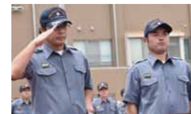
↑表彰を受ける優勝した第三分団の皆さん。

7月2日(日)、日頃の鍛錬の成果を競う消防操法大会が開かれました。ポンプ車を起点にホースを伸ばし、火点に向かって全力疾走。安全確認と動きの連携も決して怠りません。優勝した第3分団を筆頭に、3位までを三芳町の消防団が独占。自らの手で地域を守るという意志の強さが感じられました。