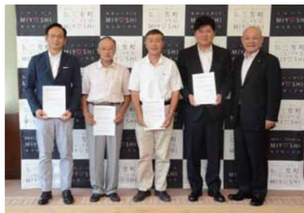
↓認定農業者に認定された皆さんと林町長。