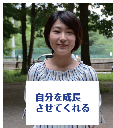
元ジュボラ・現青少年相談員