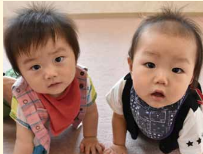
たくさんのおもちゃを見て興味津々の子どもたち。お友達におもちゃを貸してあげられた優しい子ども。