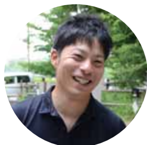
青少年相談員会長