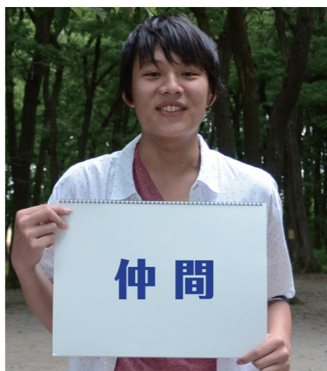
元ジュボラ・現青少年相談員

ジュボラの仲間は仲が良いので、壁がない感じで話しやすいです。楽しく活動できています。たまにジュボラの活動以外でも会って遊ぶくらい仲良くしています。イベントでは、高尾山に行った時が、わいわい楽しく山登りができて思い出に残っています。ジュボラは中学1年から入って、高校生で抜けた時期はあったけれど、また入りなおして、今の青少年相談員へつながっています。相談員になったのも、ジュボラのおかげで相談員の人に声をかけてもらったことがきっかけです。