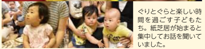
ぐりとぐらと楽しい時間を過ごす子どもたち。紙芝居が始まると集中してお話を聞いていました。