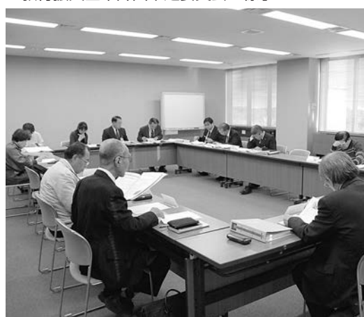
▼教育振興基本計画策定委員会の様子

意見募集方法 募集期間…1月1日(日)～31日(火) 募集方法…意見書を教育総務課・各公民館の窓口へ直接提出してください。所定の様式は、町ホームページ、教育総務課、各公民館で入手できます。 ■いただいた意見は、原則公表し、今後の計画策定の参考にします。なお、ご意見に対しての個別の回答はしませんのでご了承ください。 ☎教育総務課施設庶務係 (TEL)535 (FAX) (274) 1056