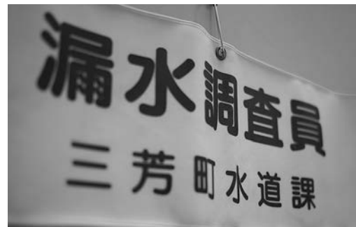
▼(写真)調査員の腕章

【委託業者】 株式会社日本漏防コンサルタント 【調査期間】 1月10日(火)～3月22日(木) 【調査区域】 藤久保第4区・みよし台第1区