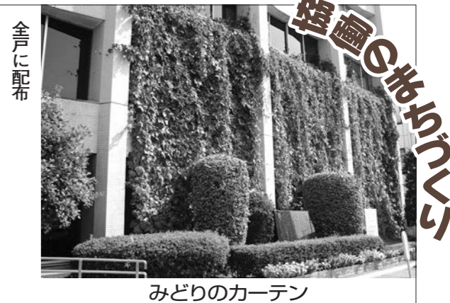
みどりのカーテン