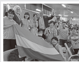
世界柔道選手権でオレンジカラー に染まった「チーム三芳」

入会金：個人3,000円／団体30,000円(年会費無し) 入会特典：オレンジシャツの贈呈、各種交流イベントへの招待 入会のお申込み・お問合せ： MIYOSHIオリンピック推進課(三芳町役場4階) 049-258-0019