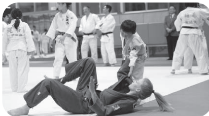
三芳町柔道連盟の 子どもたちとの 柔道交流