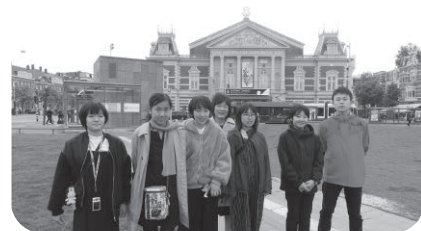
世界に名高い コンサートホール 「コンサートヘボウ」前で 記念撮影