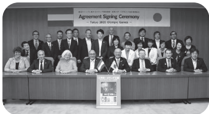
オランダ柔道連盟、 淑徳大学、三芳町の 3者協定を結ぶ