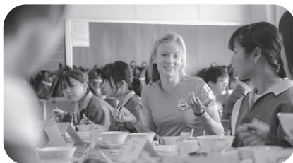
中学生と給食を食べながら お互いの文化について 語り合いました