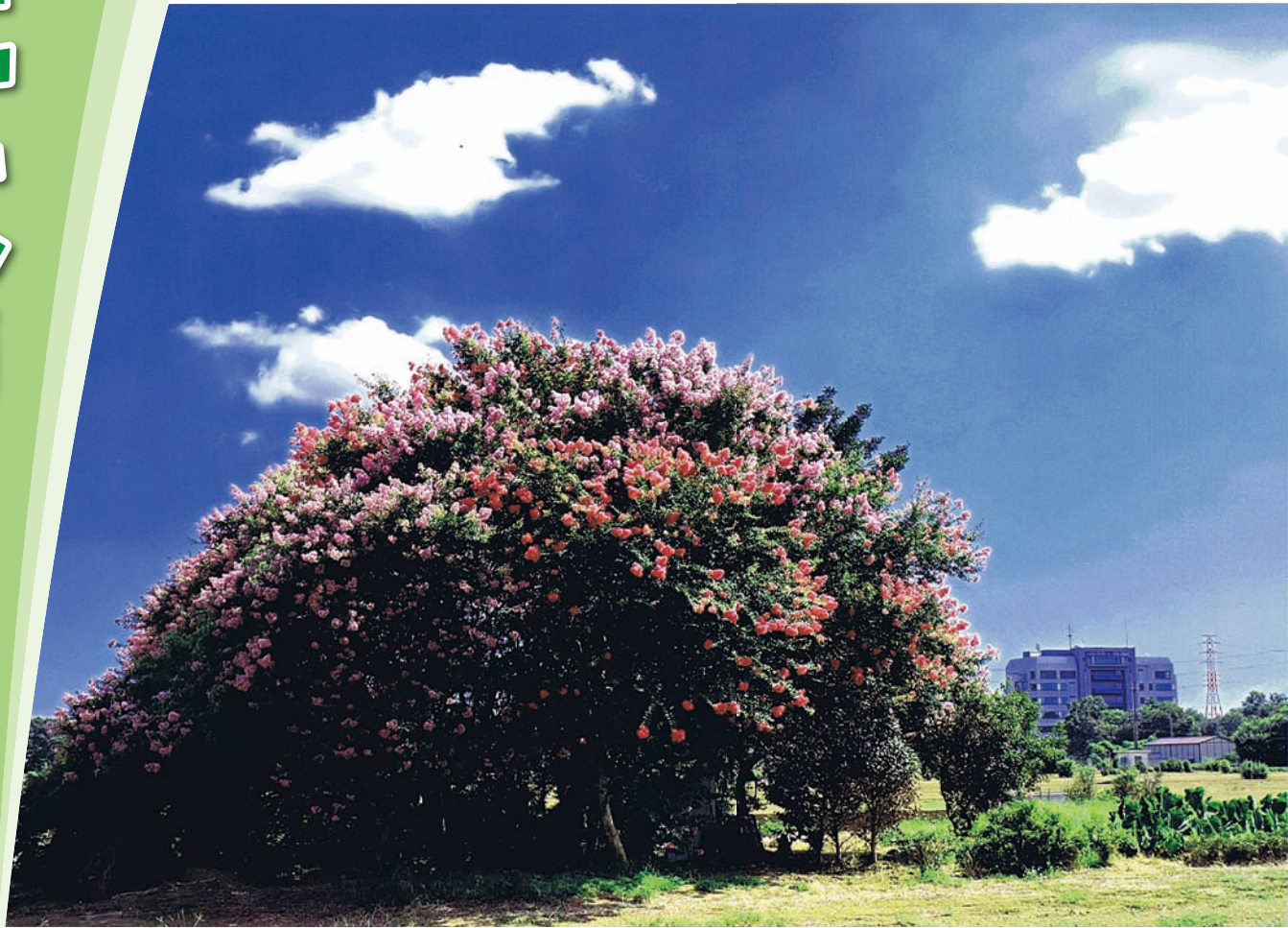
盛夏 撮影者：島崎さん（みよし台在住）